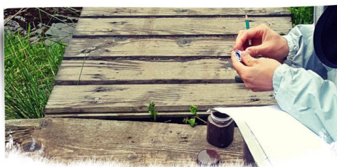
Une géocache en préparation... Pourrez-vous la retrouver ?

Plus d'infos sur : www.crlesse.be/geocaching