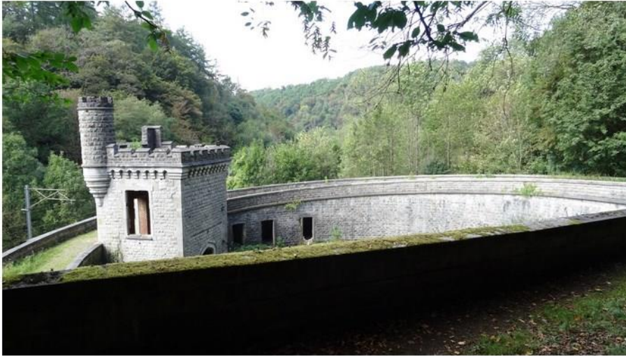
La halte Royale d'Ardenne

Au rayon des curiosités, citons la passerelle métallique construite sur le chemin vicinal n°9 reliant Houyet et Custinne. Cette passerelle, la dernière des 10 ayant existées sur l'Ywoigne, avait encore tous les éléments de sa construction de la fin du 19e siècle, mais fortement endommagés. A l'origine, ces passerelles placées à côté d'un gué, servaient de passage «à sec» pour les piétons, journaliers et autres colporteurs. Les associations « Les Sentiers de Grande Randonnée » et « Les Naturalistes de La Haute Lesse » ont été à l'initiative de la rénovation de celle-ci, effectuée par la commune de Houyet en 2014. Ce petit pont figure sur le parcours du GR 577, tour de la Famenne.