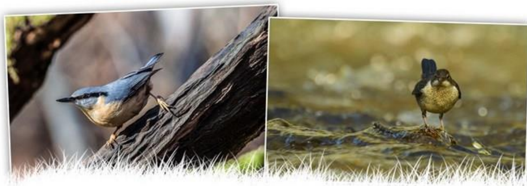
A gauche, la Sittelle, à droite, le Cinque...

Sur ces différentes boucles, vous pourrez également découvrir les villages environnants comme Celles, Gendron, Custinne... Parmi les tracés possibles, citons la très diversifiée « promenade de l'Ywoigne » (balisage losange jaune), au départ de Gendron, disponible sur la carte IGN des promenades consacrée à Houyet.