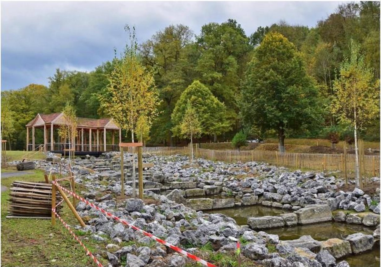
Le pont palladien en octobre 2020, l'aménagement suit son cours.

« Situé dans le Condroz méridional, entre Ciney et Rochefort, le Domaine Provincial de Chevetogne s'étend sur près de 500 hectares, dont 375 ha de forêts. Si une partie a une vocation touristique, accueillant annuellement plusieurs dizaines de milliers de personnes, le site comprend également de vastes surfaces peu ou non fréquentées et une diversité remarquable d'habitats et d'espèces. Les chênaies-frênaies neutrophiles subatlantiques représentent le groupement forestier dominant, sous plusieurs variantes. On rencontre également des chênaies-charmaies famenniennes et, plus localement, des aulnaies-frênaies alluviales et aulnaies marécageuses. Les plantations résineuses sont peu nombreuses, de même que les plantations de feuillus exotiques. Les parties ouvertes ne sont certainement pas dénuées d'intérêt: bien que peu étendues, les prairies maigres, les pelouses sèches et les zones humides contribuent à l'originalité et à la valeur patrimoniale du domaine. La gestion écologique mise en place, incluant la fauche tardive des prairies et des talus de voiries ainsi que la création d'une réserve forestière intégrale de plus de septante hectares, se conjugue avec la volonté de concilier loisirs actifs et respect de l'environnement ».