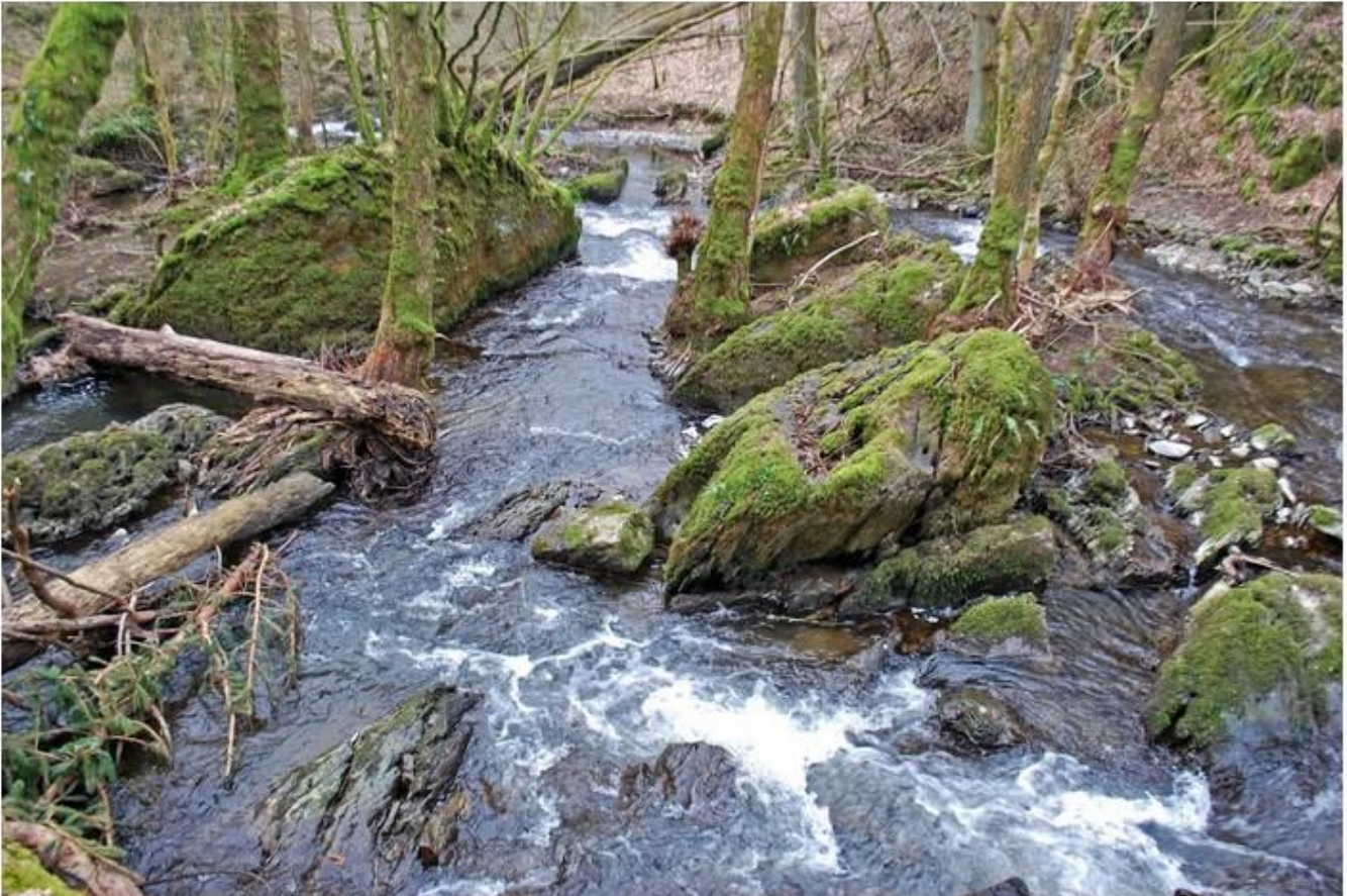
L'Ywoigne sauvage et tumultueuse.

Masse d'eau n° 26 – L'Ywoigne ou l'Ywenne