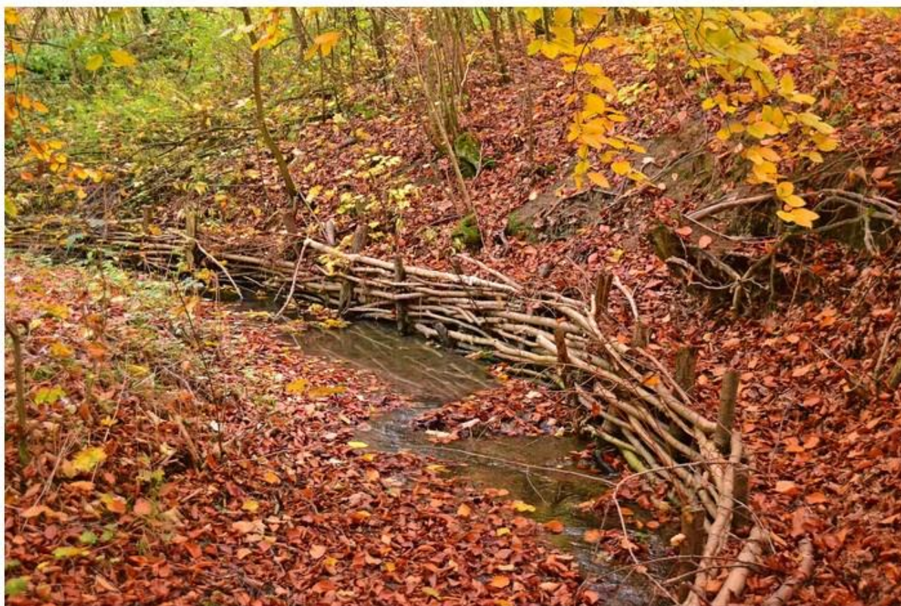
Une fascine en automne.

Un PCDN ? Initié en 1995, le Plan Communal de Développement de la Nature est un outil proposé aux communes pour organiser de façon durable la prise en compte de la nature sur leur territoire en intégrant le développement économique et social. Le PCDN vise à maintenir, à développer ou à restaurer la biodiversité au niveau communal en impliquant tous les acteurs locaux, après avoir réalisé un diagnostic du réseau écologique et dégagé une vision conjointe de la nature et de son avenir au niveau local ! L'Administration Communale de Tellin est entrée dans cette dynamique en mars 1998.