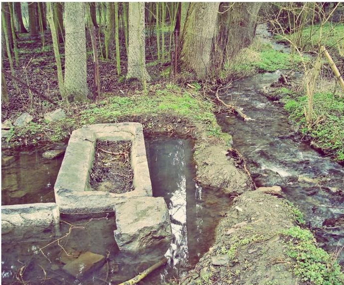
Ancienne fontaine sur le ruisseau du Village à Resteigne.