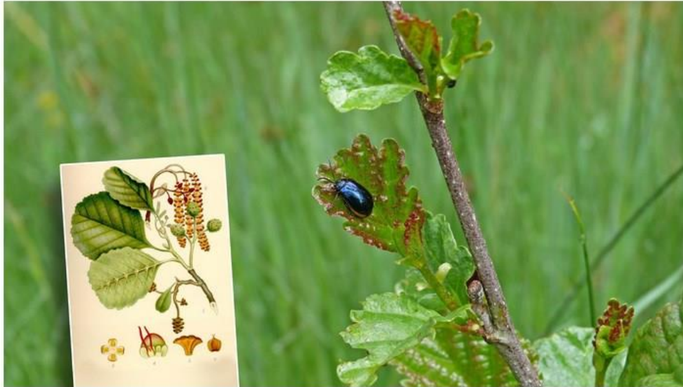
Une branche d'aulne & un Chrysomèle de l'aulne ( Agelastica alni ) Coléoptère fortement inféodé à l'aulne.

Peu connu, le vallon du ruisseau de Grimbiémont, entièrement inclus dans le vaste massif forestier de Hampteau-Marenne, est un « SGB » ; Site de Grand Intérêt Biologique. Il a été parcouru et inventorié par les Naturalistes de la Haute Lesse en juillet 2002.