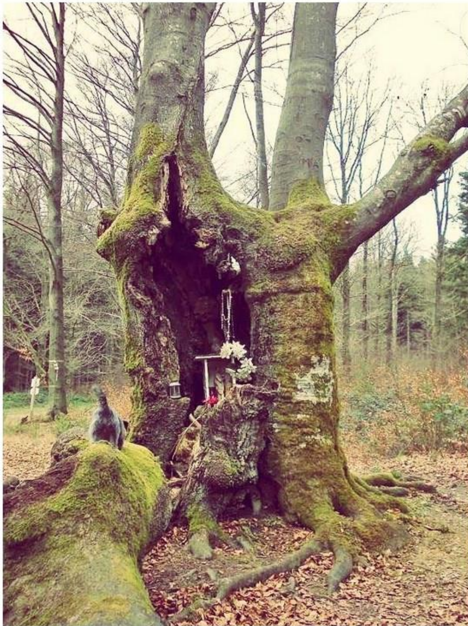
Le Hêtre à la vierge du Fays