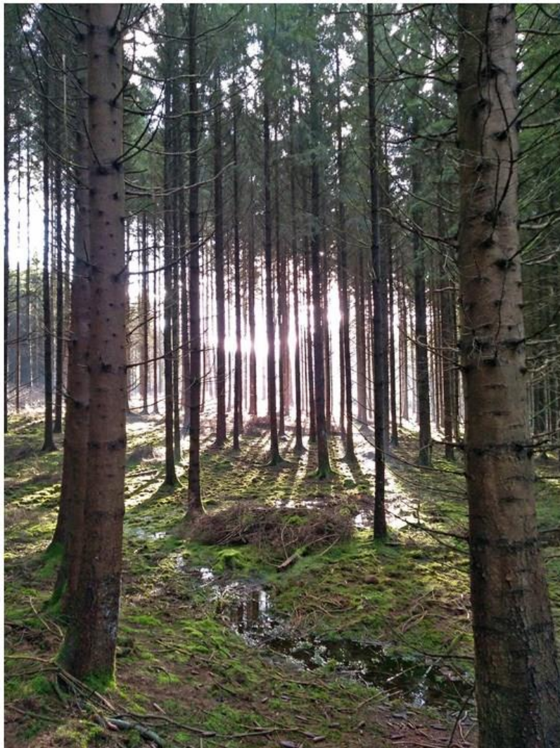
Une vue du Rau del Deffe, voisin proche du ruisseau de la Taille de Hotton