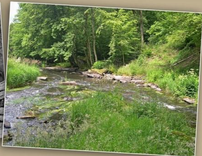
A gauche, une carte postale de 1900 depuis la Roche aux Chevaux. A droite, au niveau de la confluence de nos jours.