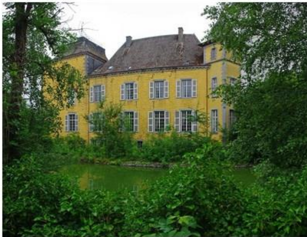
Le "château jaune" de Haversin