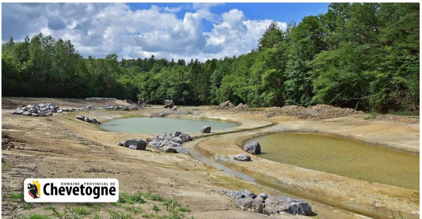
La future zone humide du Domaine de Chevetogne.

Et notre ruisseau continue sa course et sur environ 2km et fait alors office de limite communale entre Ciney et Rochefort.