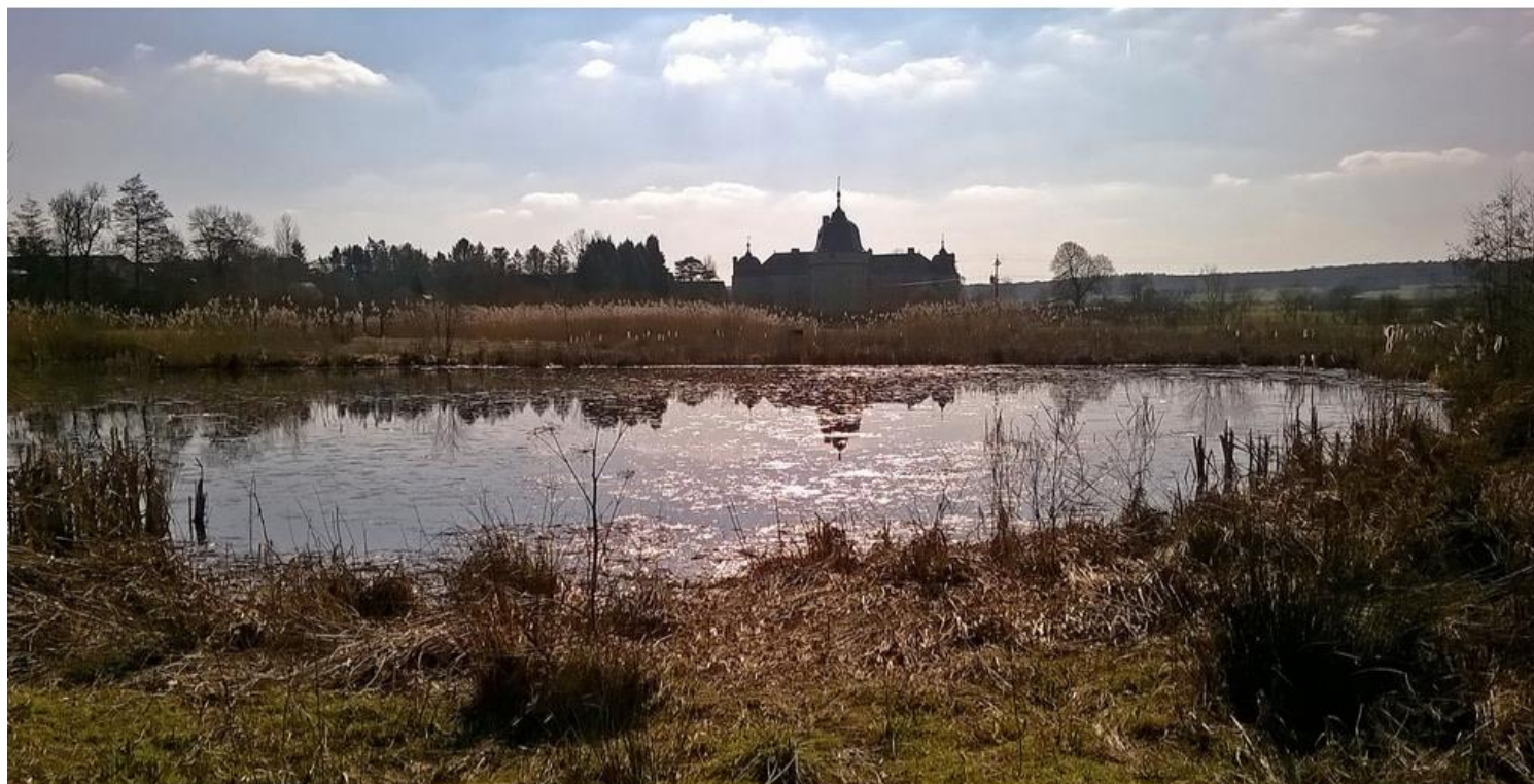
Vue du château de Lavaux-Sainte-Anne depuis la zone humide

Ces milieux sont par ailleurs très bien mis en valeur au château de Lavaux-Sainte-Anne, où une zone humide typiquement Famennoise été reconstituée dans les années 2000. Le marais, la prairie et l'étang, visitables, sont à l'image de ce qu'étaient ces biotopes à la fin du 19ème et début du 20ème siècle.