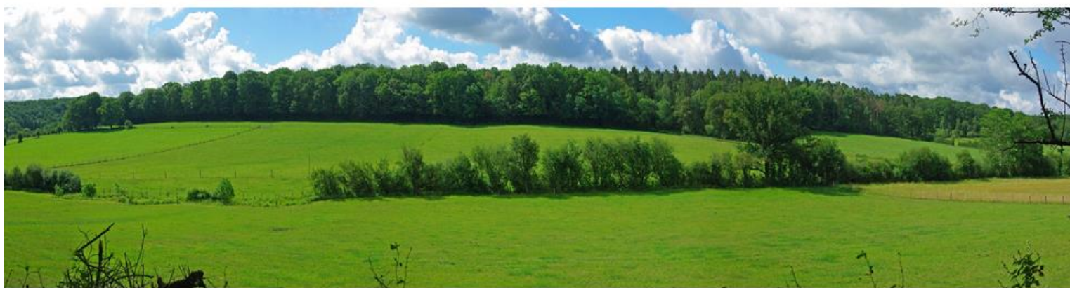
Le ruisseau de Jawet au milieu des prairies