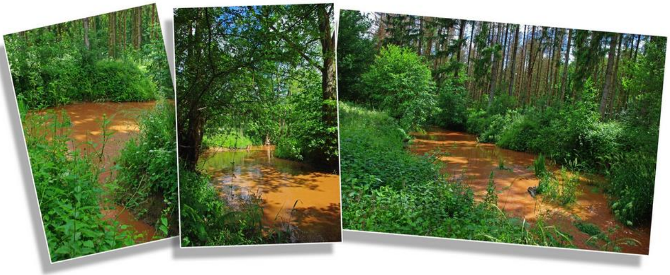
Confluence du ruisseau de Jawet et de la Wimbe. Clichés pris le lendemain de violents orages ayant charrié des terres en abondance, d'où la couleur de l'eau de la Wimbe ayant un effet sur celle du Jawet...