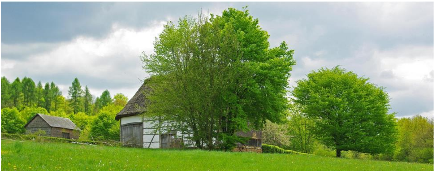
Vue du Fourneau Saint-Michel.