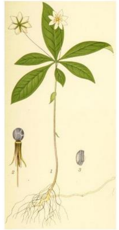
Trientale d'Europe.

C'est la Fagne de la Doneuse. Ce site remarquable, bien que fortement enrésiné, est inclus depuis 2011 dans la zone humide d'intérêt biologique du plateau de Saint-Hubert. On y retrouve ainsi une faune et une flore assez typique des landes tourbeuses, comme la fougère des montagnes ( Oreopteris limbosperma ) et la trientale ( Trientalis europaea ). Deux libellules rares y ont aussi été observées ces dernières années : l'orthétrum bleissant ( Orthetrum coerulescens ) et la cordulie arctique ( Somatochlora arctica ).