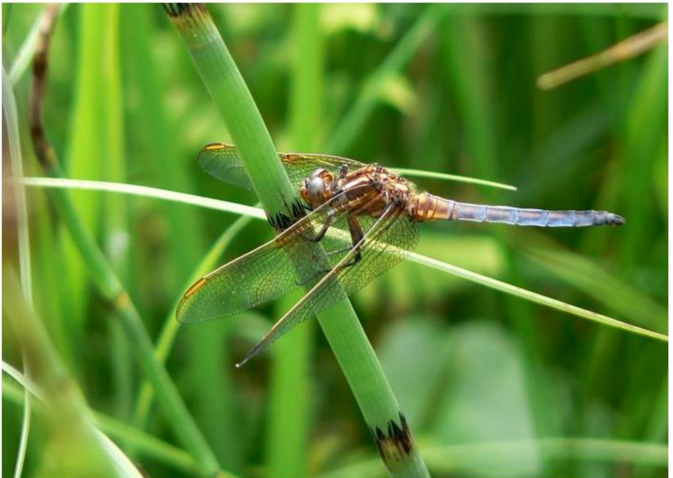
Orthétrum bleissant ( Orthetrum coerulescens ). Mâle immature.