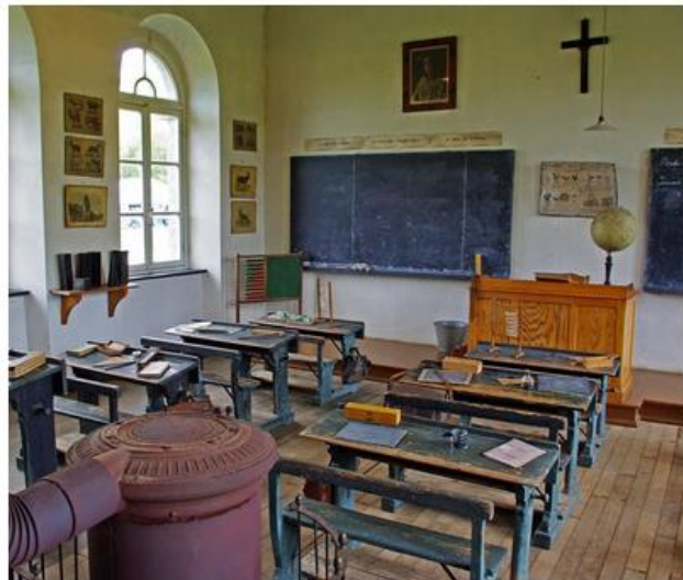
L'école du Fourneau Saint-Michel.

Plus d'infos sur cette randonnée : https://www.foretdesainthubert-tourisme.be/ https://www.cirkwi.com/fr/circuit/141895-saint-hubert-chemins-de-solitude .