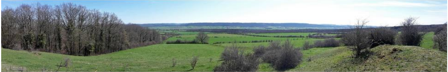
La plaine de Focant, vue depuis les prairies du Hameau de Famenne, près du village de Hour.

Le Biran prend sa source au sud-ouest du parc du Castel à Beauraing qu'il longe en bordure de celui-ci avant de devenir invisible aux yeux des Beaurinois en devenant souterrain la majeure partie de la traversée de la ville. Il traverse ensuite, tout au long de son cours une plaine au sol argileux et schisteux typique de la Famenne. Vers Gozin et Focant, le ruisseau rencontre des prairies permanentes pâturées, des prés de fauche entrecoupés de nombreux fossés, des haies, des bouquets d'arbres isolés... L'intérêt paysager et faunistique est très grand. Enfin, après 17,068 km, le Biran arrivant sur la commune de Houyet se jette en rive gauche dans la Lesse à Wanlin.