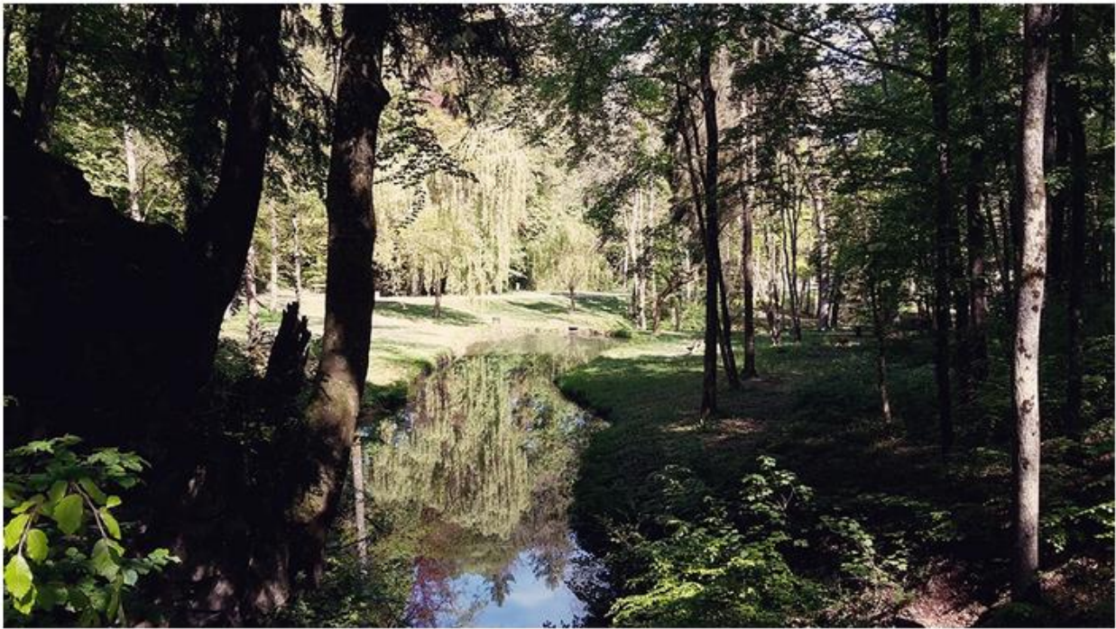
Le parc du Caste Saint-Pierre à Beauraing