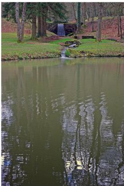
Le parc du Caste Saint-Pierre à Beauraing

Le parc communal du Castel Saint-Pierre à Beauraing (accessible gratuitement tout au long de l'année, sauf certains événements) d'une superficie de 27 hectares de bois est le lieu idéal pour une promenade relaxante. Riche d'un cadre verdoyant typique des sols calcaire de la Calestienne, le parc abrite un arboretum composé d'une cinquantaine d'essences forestières. Dans le parc, le Biran se fait discret, l'œil étant plus attiré par les nombreux étangs, propices au calme et à la contemplation. Plus haut sur le site, dans le parc du Castel Saint-Marie, l'ancien château de Beauraing datant du 13ème siècle permet lui, de voyager dans le temps. il est possible, via un sentier de profiter depuis le pied des tours, d'une vue magnifique sur la ville et la plaine de Focant. L'équipe du Contrat Rivière investit parfois les lieux pour y animer les élèves des