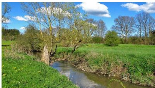
Le Biran aux alenours de Focant.

nom de Biran. À noter également que le nom Biran est commun à deux autres cours d'eau du sous-bassin : le Petit Biran, affluent du Biran à Gozin (Beauraing) et le ruisseau du Biran, dont nous reparlerons, dont les sources naissent non loin de Aye (Marche-en-Famenne) et qui se jette dans la Lomme à (Rochefort).