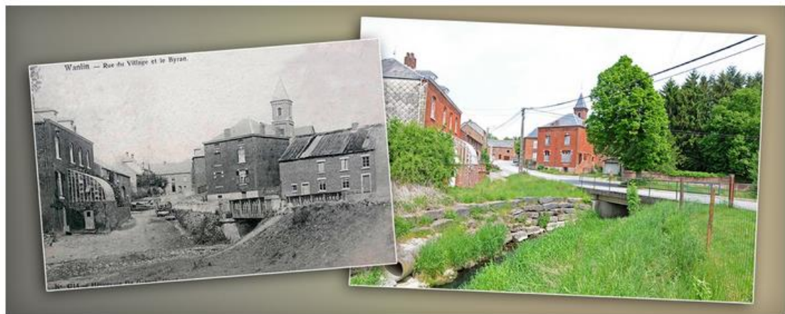
Carte postale & photographie – coll. Daniel FRANQUIEN

Et le Biran, après 17km, finit sa course dans la Lesse à Wanlin (Houyet). Le parcours du Biran se situe donc sur 2 communes. Pour information, les communes de Beauraing et de Houyet se retrouvent aussi sur le sous-bassin de la Haute-Meuse... Le relief terrestre et les cours d'eau ne connaissent pas les frontières. Signalons que le sous-sol argileux de la région a fourni à l'ancienne briqueterie de Wanlin de quoi fabriquer briques et tuiles pour toute la région durant plus d'un siècle. Parler de l'ancien temps nous permet de vous présenter ces deux prises de vue, prises dans le centre de Wanlin à plus d'un siècle d'écart.