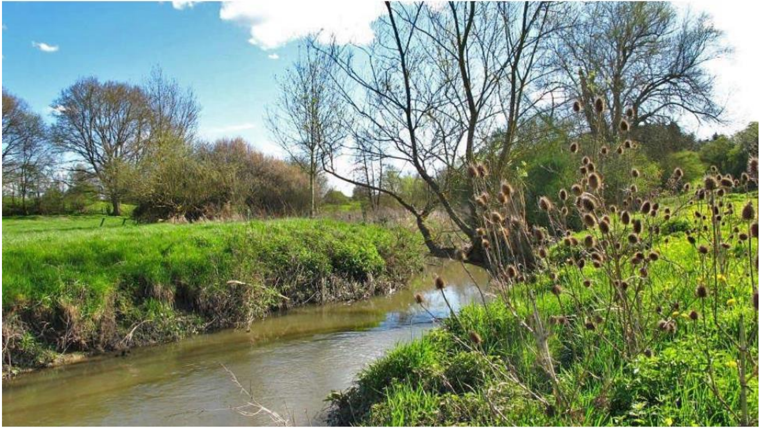
Le Biran aux alenours de Focant.

Et le Biran, après 17km, finit sa course dans la Lesse à Wanlin (Houyet). Le parcours du Biran se situe donc sur 2 communes. Pour information, les communes de Beauraing et de Houyet se retrouvent aussi sur le sous-bassin de la Haute-Meuse... Le relief terrestre et les cours d'eau ne connaissent pas les frontières. Signalons que le sous-sol argileux de la région a fourni à l'ancienne briqueterie de Wanlin de quoi fabriquer briques et tuiles pour toute la région durant plus d'un siècle. Parler de l'ancien temps nous permet de vous présenter ces deux prises de vue, prises dans le centre de Wanlin à plus d'un siècle d'écart.