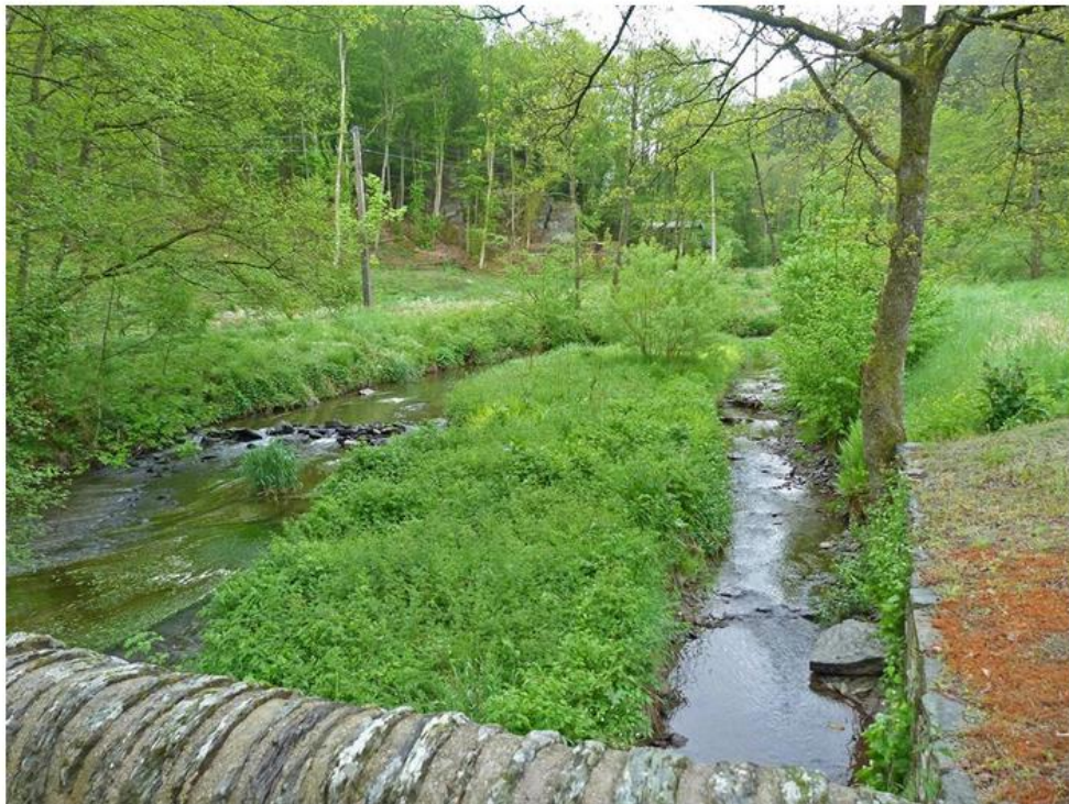
Vue depuis le Pont des Gades