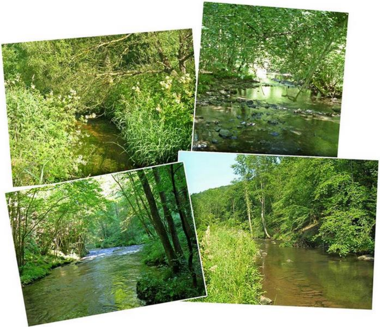
L'Almache entre Gembes et Daverdisse

L'Almache finit sa course, au nord du village de Daverdisse à hauteur du moulin du même nom, en rive gauche de la Lesse. Le parcours de l'Almache, d'une longueur de 12,64 km, est riche en patrimoine, en témoignent quelques édifices heureusement bien conservés qui jalonnent ce cours d'eau. En voici quelques-uns :