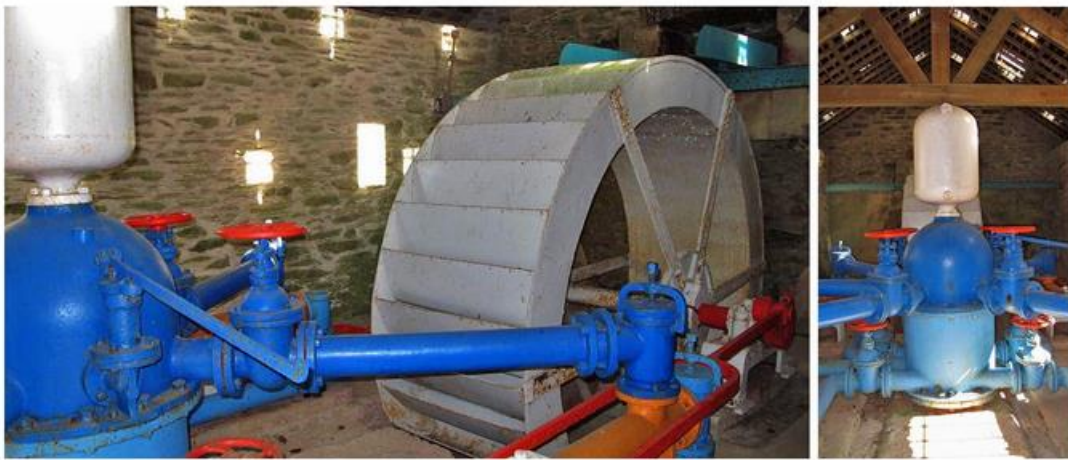
La roue à aube et la pompe à eau de Porcheresse.