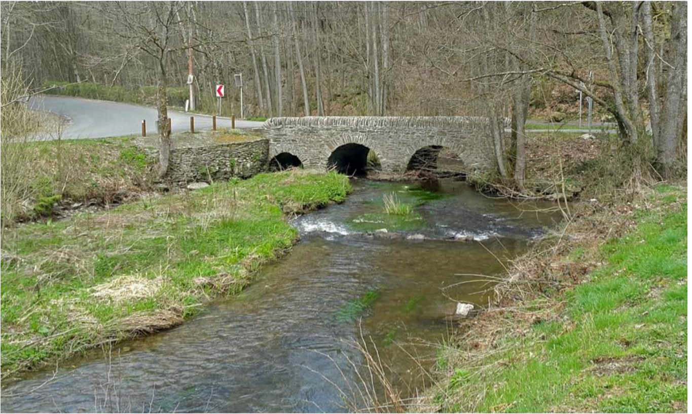
Le Pont des Gades à Gembes