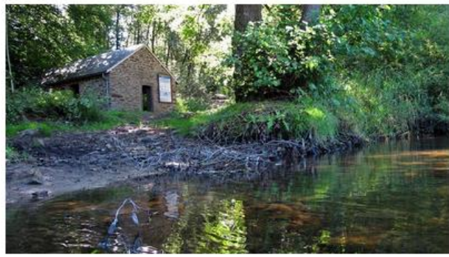
La pompe à eau de Porcheresse.

La pompe à eau de Porcheresse. Fonctionnant à l'aide d'une roue à aube grâce à la force du courant de l'Almache, cette pompe a permis, bien avant beaucoup d'autres villages, de distribuer de l'eau aux habitants de Porcheresse. Elle puisait de l'eau de la nappe phréatique et l'élevait jusqu'à un réservoir situé 48 mètres plus haut. Mise en service en 1870, elle a fonctionné jusque dans les années 1950. Il est possible de la visiter, pour plus d'informations : https://pompeaeau.jimdofree.com/