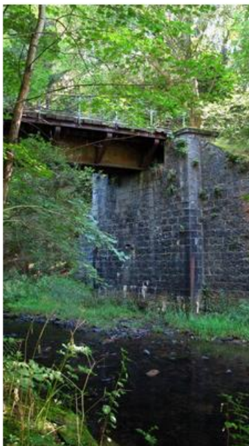
Le pont de fer de l'ancien vicinal.

Autrefois, le tramway vicinal à vapeur reliant Wellin à la gare de Graide. Il a fonctionné depuis la fin du XIXe siècle jusqu'après la Seconde Guerre mondiale. Le tracé aujourd'hui converti en voie lente, permet de faire de très belles balades dans la région. Elle longe l'Almache et la Lesse sur une vingtaine de kilomètres via un itinéraire alternatif et complémentaire au Ravel intitulé et labellisé PICverts. Découvrez le parcours ici : https://walloniebelgiquetourisme.be/fr-be/produit/attractions/activites/promenade-a-velo/balade-picverts-en-haute-lesse-circuits-velo-en-wallonie/8104