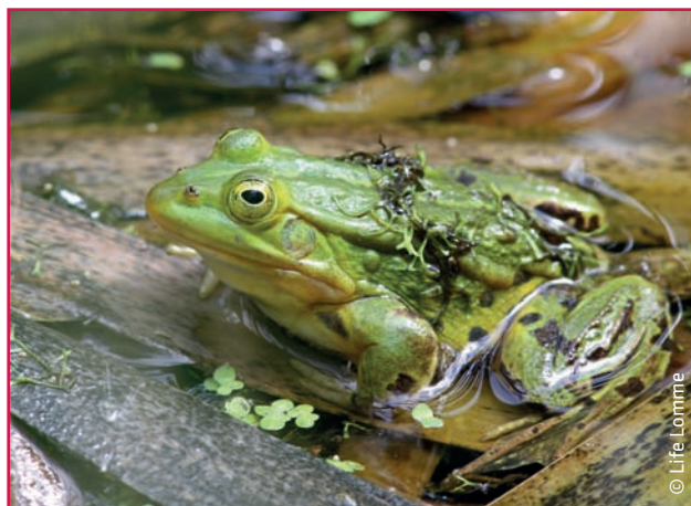
La grenouille verte.

libellules ou encore nos petites amies bondissantes, les grenouilles. Selon la saison à laquelle vous vous rendez à la mare vous pourrez entendre ces dernières coasser, s'ébattre gaiement dans l'eau claire et peut-être, un mois plus tard, observer leurs petits têtards nager dans l'eau. Ce sont de futures grenouilles qui comme leurs parents profiteront de la forêt toute proche pour s'offrir un peu d'ombre et de quiétude.