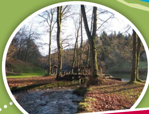
Confluence de l'Antrogne et de la Semois