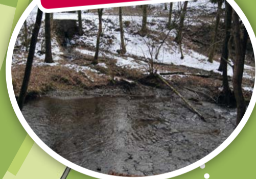
Pont et Goutelle du Noir Epinoi