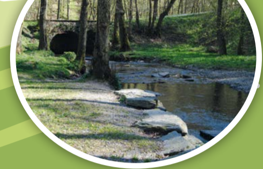
Le vieux Pont (Les Forges)