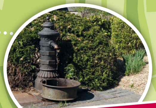
Borne-fontaine de la rue de la Hulette