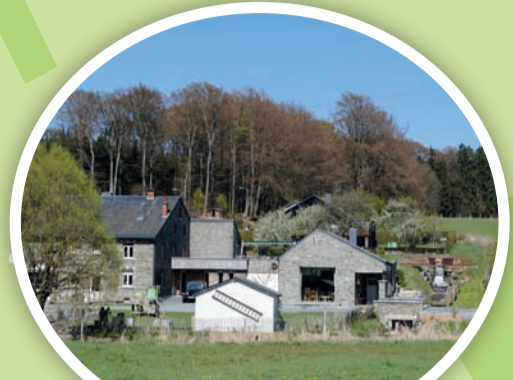
Moulin de Sart