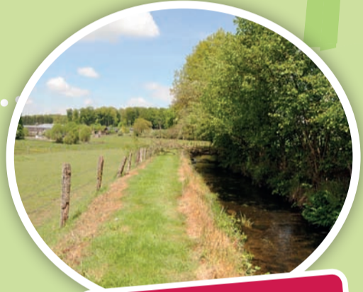
Bief d'alimentation du Moulin de Sart