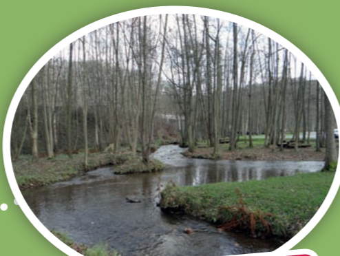
La qualité de l'eau