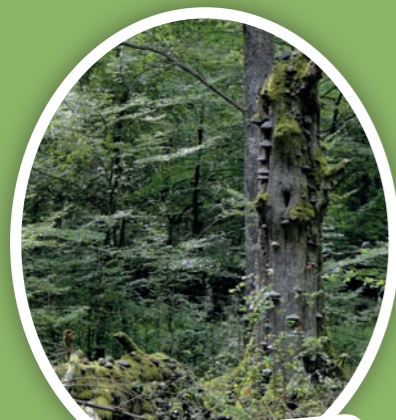
Les arbres morts