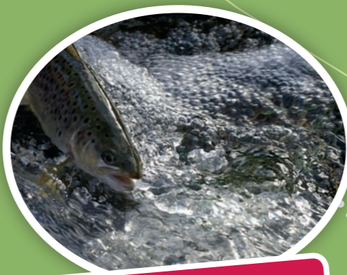
La truite et l'écrevisse