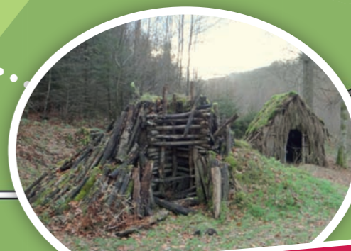
L'exploitation du charbon