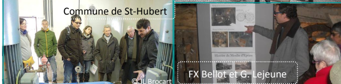
Commune de St-Hubert