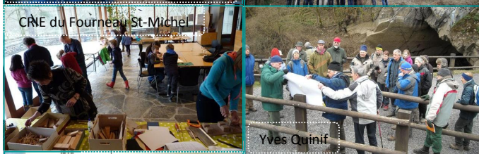
CRNE du Fourneau St-Michel