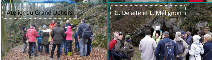
Atelier du Grand Dehors