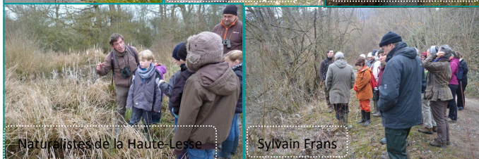
Naturalistes de la Haute-Lesse