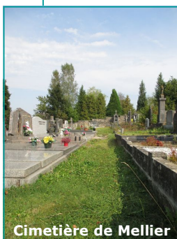
Cimetière de Mellier

Reportage TV Lux consultable via le lien : http://www.tvlux.be/video/info/nature/leglise-une-gestion-naturelle-des-parcelles-communales_24090_344.html