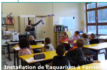
Installation de l'aquarium à Forrières

de Mirwart afin de se familiariser avec le monde des salmonidés. Ils ont ainsi déjà pu se rendre compte que ceux-ci avaient besoin d'une eau propre et bien oxygénée pour pouvoir atteindre l'âge adulte.